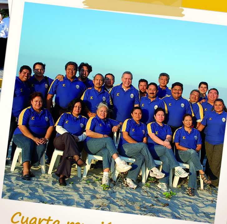
Cuarta reunión de trabajo en Isla Aguada